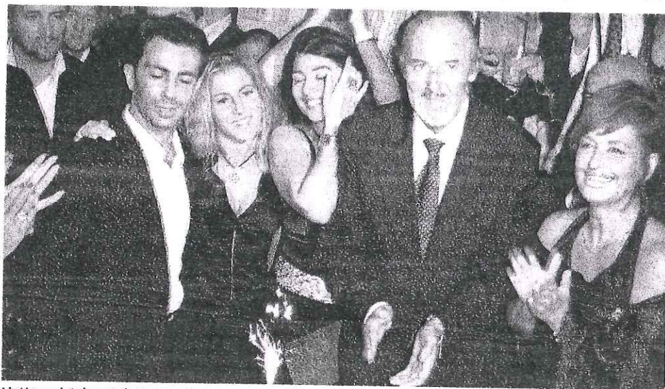
L'attore pistoiese Enio Drovandi stasera riceverà il premio alla carriera